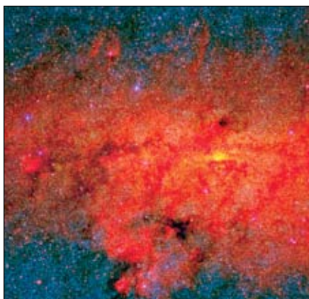
Vista hacia el centro de la Vía Láctea.

Hay galaxias de muchos tipos y tamaños diferentes. La nuestra, la Vía Láctea, es una galaxia espiral y parece un molino con aspas de estrellas, gas y polvo. Puedes construir tu propia Vía Láctea con materiales que puedes comprar en una tienda. Antes de empezar esta actividad, repasa la sección Galaxias: ciudades de estrellas, y busca la información básica sobre nuestra galaxia.