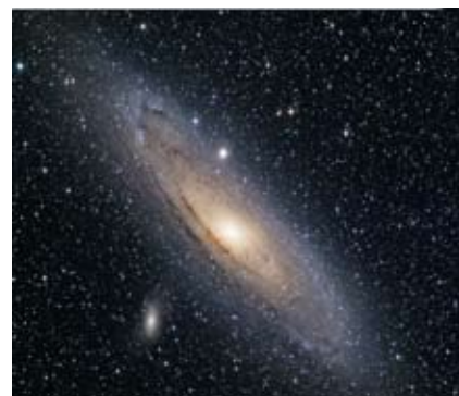
La galaxia de Andrómeda