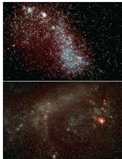
La Pequeña (arriba) y la Gran Nube de Magallanes

Puedes usar tu modelo para comprender tu posición en la galaxia. Cuando miras hacia las estrellas de la constelación de Sagitario, estás mirando al centro de la galaxia. Alinea el centro de tu modelo con Sagitario. Luego alinea el disco de tu modelo con la Vía Láctea en el cielo y podrás ver nuestra posición en el interior de nuestra galaxia.